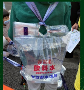
リュック型給水袋